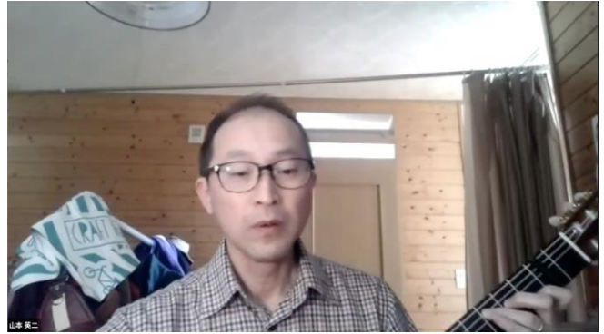
(2) 「Blue Light」を巡って