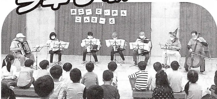
▲富山アコ研 保育園での「こんさーと」(10月)