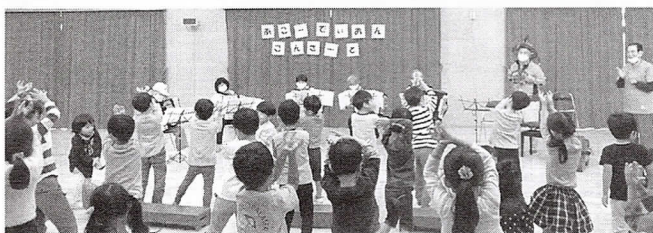
アコ合奏「パプリカ」で歌って踊る園児

演奏は、アコ合奏3曲、独奏2曲、秋の歌4曲など。圧巻は「パプリカ」の合奏に合わせて園児たちが歌って踊ってくれたことです。演奏することが少ない中で、嬉しい時間を過ごしました。(磯野滋子)