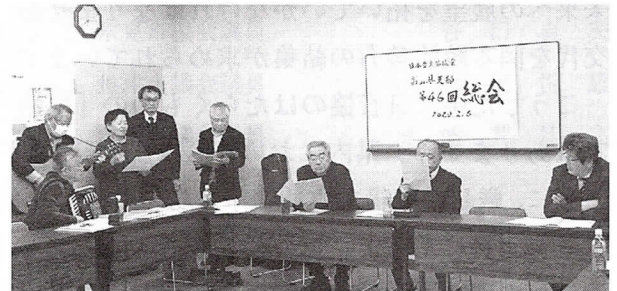
▲第46回県支部定期総会で（2月）