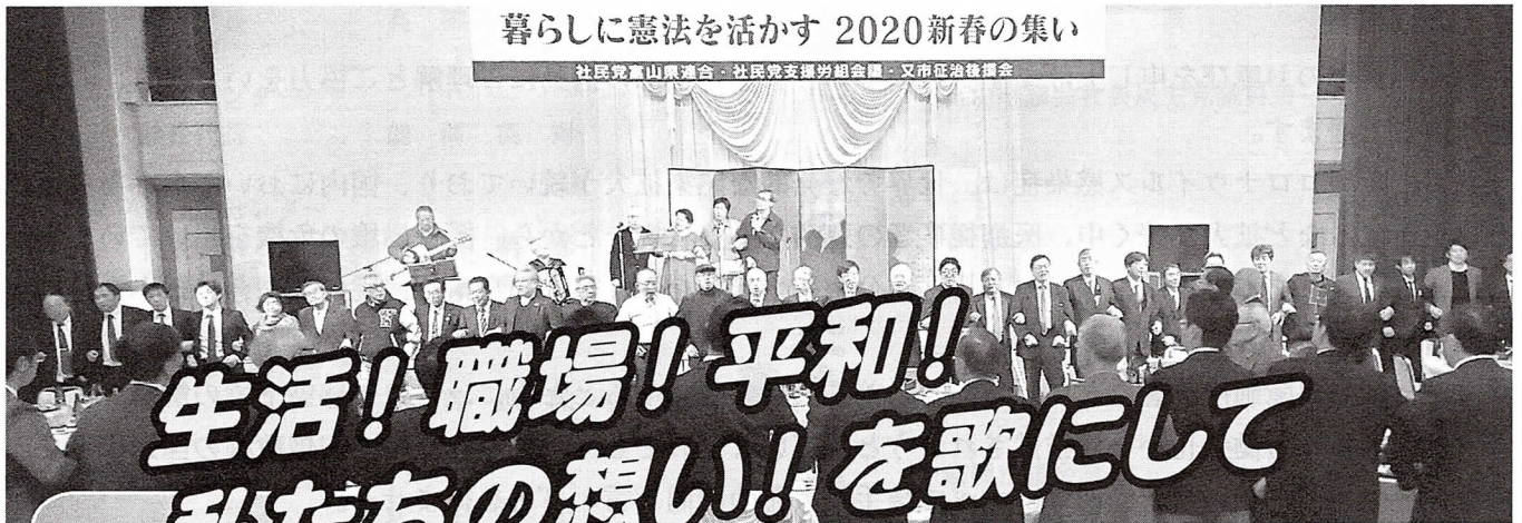
暮らしに憲法を活かす 2020新春の集い